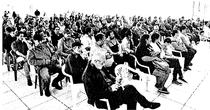
Centro Social do Bairro Padre Ulrico, Beltrão, lotado por moradores do Terra Nossa para receber seus títulos de proprietários dos terrenos onde construíram suas casas.